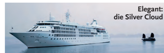
Elegant: die Silver Cloud