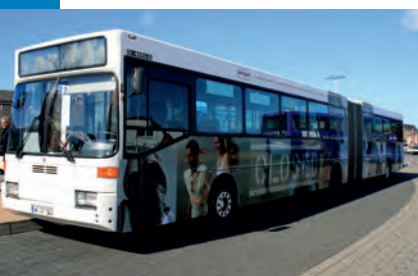
Frische Models: hippe Closed-Beschriftung