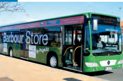
Grün, grün, grün: auffälliger neuer Barbour-Bus