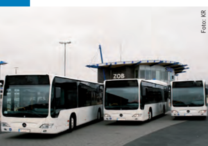
14. Ausgabe • April 2008 • an alle Sylter Haushalte mit Tagespost Noch nackt: neue SVG-Busse am ZOB, unmittelbar nach ihrer Landung auf der Insel