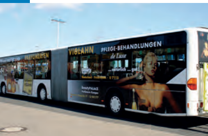
Beauty-Bus: unterwegs für die Parfümerie »Viglahn«