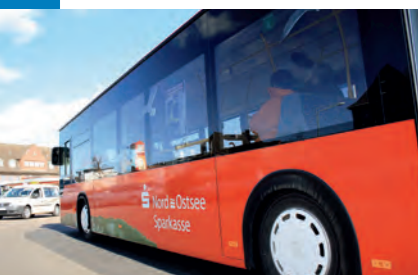
Rot und gut: Buswerbung für die NOSPA