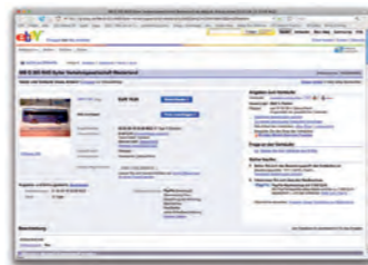
Sylt auf ebay: Rundfahrtbus unterwegs im Internet

Jetzt ist die SVG sogar schon auf ebay unterwegs: Dort versteigerte ein Fachhändler (»Sammelermodell!«) erstmals einen der Miniatur-Rundfahrtbusse, die die Firma Rietze im Auftrag der SVG in Sonderauflage herstellt.