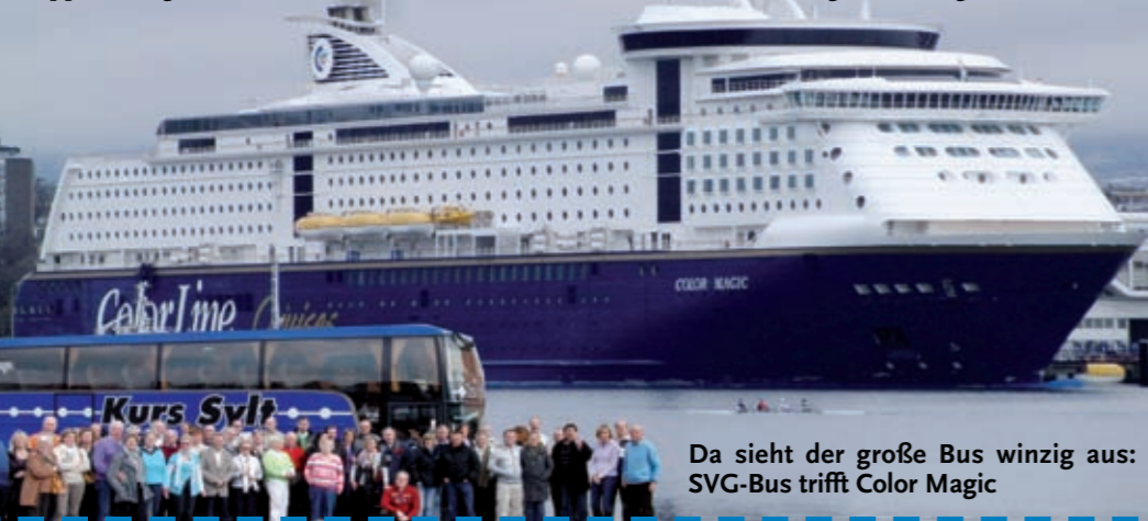
Da sieht der große Bus winzig aus: SVG-Bus trifft Color Magic