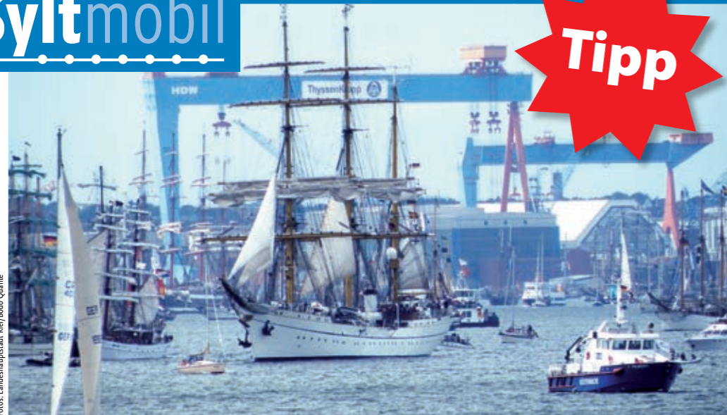
Hafenpanorama: Viel zu entdecken gibt's auf der Kieler Woche, an Land genauso wie auf der Förde