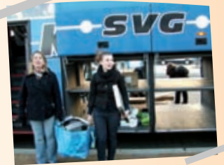
Taschen voll: Ausflug zu Ikea nach Kiel