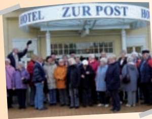
Bitte recht freundlich: Gruppenbild auf Usedom