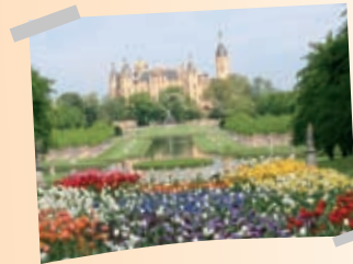
In Schwerin blühte uns richtig was!