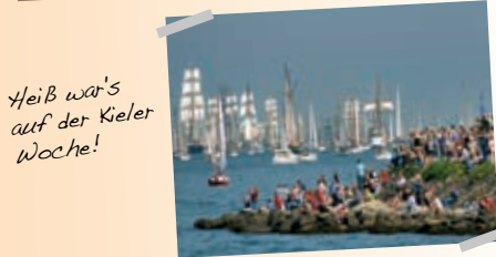
Heiß war's auf der Kieler Woche!