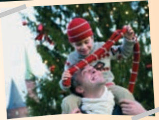
Mit Papa beim Weihnachtsmarkt in Lübeck