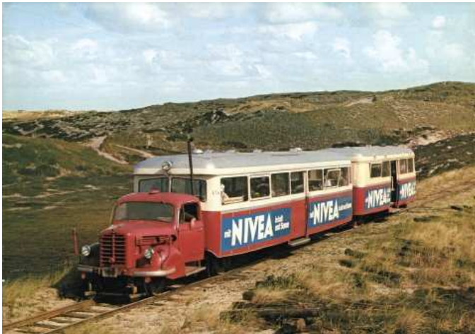
Der Borgward LT4 juckelte bis 1970 durch die Dünen zwischen Hörnum und List.