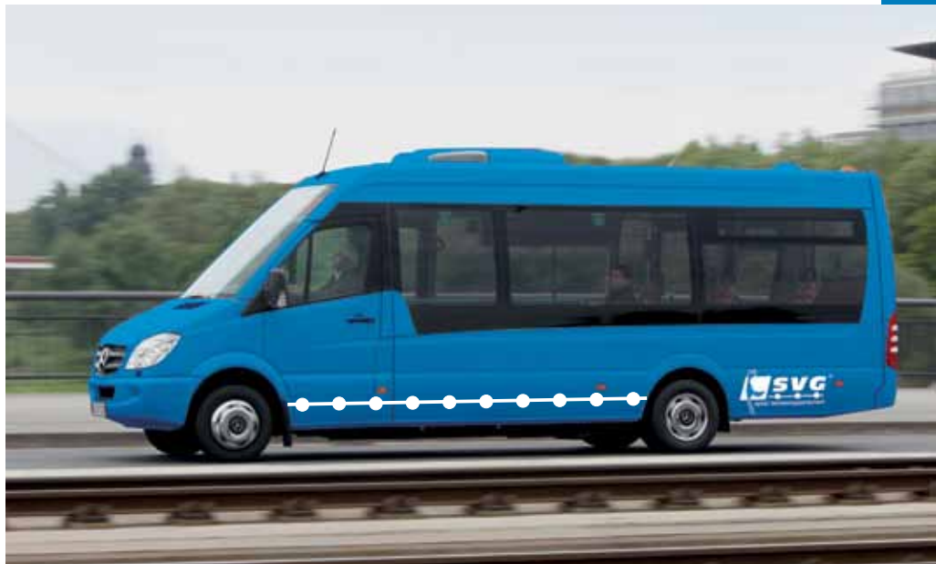
So ähnlich wird er aussehen, wenn er Sylt erreicht: der Sprinter City 35, hier ein Testwagen von Mercedes-Benz, den die Grafikerin in SVG-Blau einfärbte.