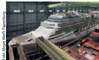
Das wollen Sylter sich im März ansehen: Dock der Meyer Werft, Papenburg