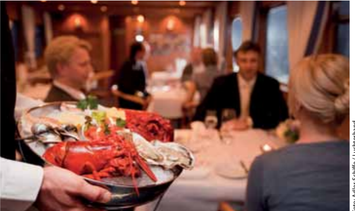
Heimatverbunden, seefest: „Fischers Fritz“ kocht auf der Merkur II