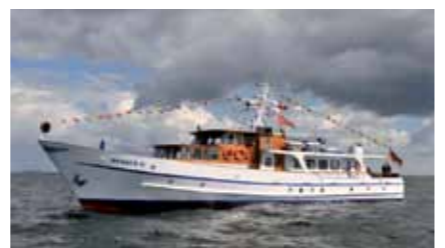
Elegante Linie: die Yacht Merkur II

Die SVG gratuliert ihrem Partner, der Reederei Adler-Schiffe, zum jüngsten Zuwachs: Seit Kurzem gehört die elegante Motoryacht Merkur II zur Flotte. Obwohl das Schiff in Kiel seinen Heimathafen hat, steht es auch für Charter, Events, Hochzeiten oder Tagungen im intimen und besonders stilvollen Rahmen vor Sylt zur Verfügung. Jetzt gelang den Adler-Mitarbeitern ein weiterer Coup: Für das Catering an Bord der edel ausgestatteten Merkur II konnte das renommierte Restaurant „Fischers Fritz“ aus dem Hotel „Birke“ in Kiel gewonnen werden – das jüngste Mitglied der rührigen und vielbeachteten Initiative „Feinheimisch“, die „Genuss aus Schleswig-Holstein“ protegiert.