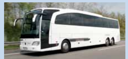
Ganz schön dick, Mann: Travego-Testbus in der ausgewachsenen L-Variante

Neu in der großen Familie des SVG-Fuhrparks ab dem kommenden Frühjahr ist auch ein weiterer Reisebus aus dem Hause Mercedes-Benz. Das ist dann schon der zweite „Travego“ im Team, diesmal allerdings in der L-Variante, also mit noch mehr Sitzplätzen (59 + zwei Reiseleiter), 428 PS-Sechszylinder-Motor und gut 14 Metern Länge. Ausgemustert wurden dafür zwei ältere Reisebusse: Einer davon ist derzeit unterwegs nach Afghanistan, der andere wurde nach Abu Dhabi verkauft und soll zukünftig auch für Pilgerfahrten nach Mekka eingesetzt werden.