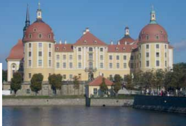
Beindruckend für die Reisenden: die markante Moritzburg