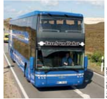
Im Winter jetzt etwas früher unterwegs: die täglichen Inselrundfahrten ab ZOB Westerland