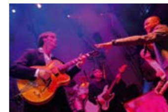
Mit Vollgas unterwegs: die „Soulisten“ treten bei der Aids-Gala 2008 auf

Zum ersten Mal findet die Aids-Gala dieses Jahr auf dem Betriebshof der SVG statt, am 15. November, in der großen Halle, mit viel Drive und Musik von den „Soulisten“. Drei Busse werden, während ihre „Kollegen“ die Nacht ausnahmsweise am ZOB verbringen, feste mitfeiern: Zwei Citaro-Gelenkbusse dienen als Lounge für den gemütlichen Schnack, ein weiterer Bus spielt Garderoben-Mobil. Tickets? Gibts für 99 € (inkl. Essen/Getränke) bei der Aids-Hilfe-Sylt oder an den TSW-Vorverkaufsstellen bei der Sylter Welle und in der Friedrichstraße.