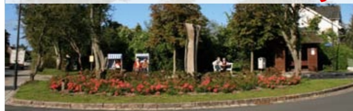
Treffpunkt Bushaltestelle: „Schnittis Eck“, mitten in Keitum

Als kommunikativer Dorfmittelpunkt hat sich „Schnittis Eck“ in Keitum entpuppt: Die vielleicht schönste Haltestelle der ganzen Insel, nett „eingrichtet“ mit Strandkörben und Bänken unter Bäumen, soll angeblich schon Fahrgäste dazu verführt haben, einen Bus sausen zu lassen, weil's sich dort so nett zusammensitzen und herrlich schnacken lässt.