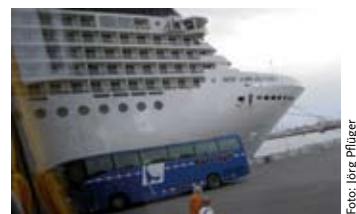
Fremdgegangen: Blauer SVG-Bus im Hafen von Rhodos

„Hat der sich etwa verfahren?“, fragte sich eine vollkommen verblüffte Familie Pflüger aus Fürstentfeldbruck, als sie im Hafen von Rhodos auf einen Sylter stieß, einen Rundfahrtbus der SVG. Keine Angst: Dieser Bus ist weder fremdgegangen noch - gefahren. Er war im Zuge der Fuhrparkerneuerung von uns vielmehr nach Griechenland verkauft, sofort eingesetzt worden und trug den auffällig blauen Sylt-Lackfrack übergangsweise noch einige Wochen.