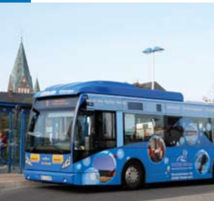
Neue Beschriftung: Stadtbus