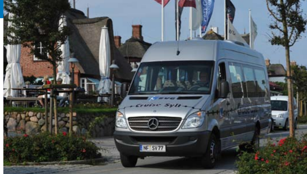
Silberner Sprinter, unterwegs in Kampen im berühmten Strönwai: unser neuer „Kleiner“

Einen neuen Frack hat sich der Westerländer Stadtbus übergezogen: Er fährt jetzt Werbung für die Sylter Welle. Und auch der Closed-Gelenkbus weist auf Neues hin: auf die jüngste große Filiale im „Keitum Hof“ (Ex-Supermarkt „Emil“).