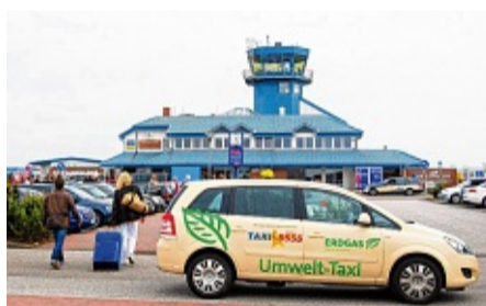
Klein, aber wichtig: Der Flughafen Sylt.

Einer der zentralen Gründe für die von Douven bezeichnete „neue, konkretere Sachlage“ sind die Stellungnahmen der betroffenen Fluggesellschaften air berlin und Lufthansa sowie des Bundesverbandes der